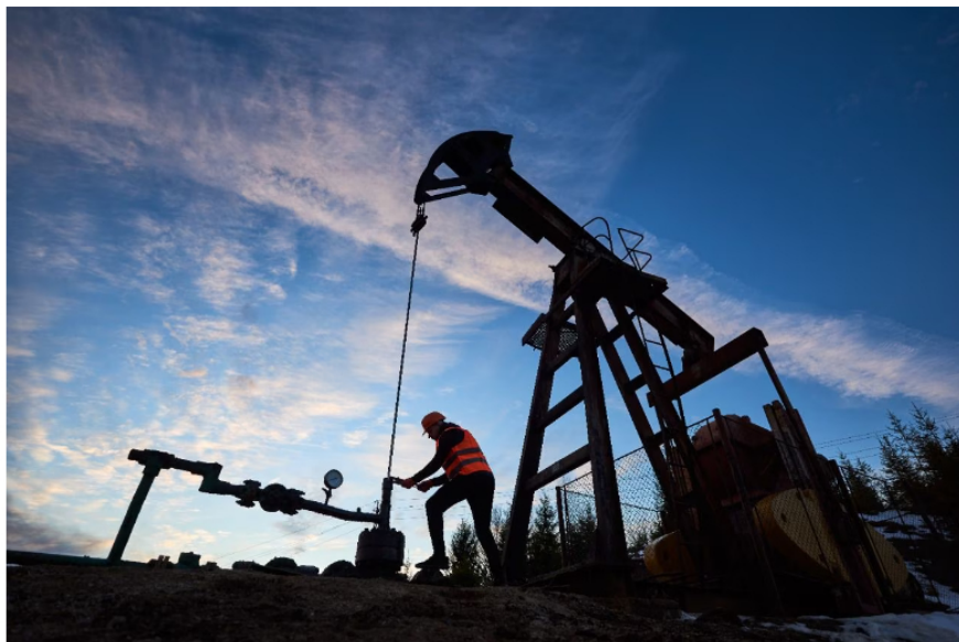
Petróleo mantiene su tendencia al alza.

Además, los precios del petróleo volvieron a subir el martes y parecieron encontrar un nuevo equilibrio, en medio de una oferta limitada y una demanda incierta. El Brent del mar del Norte para entrega en noviembre ganó 0,71 % y cerró en 93,96 dólares en Londres.