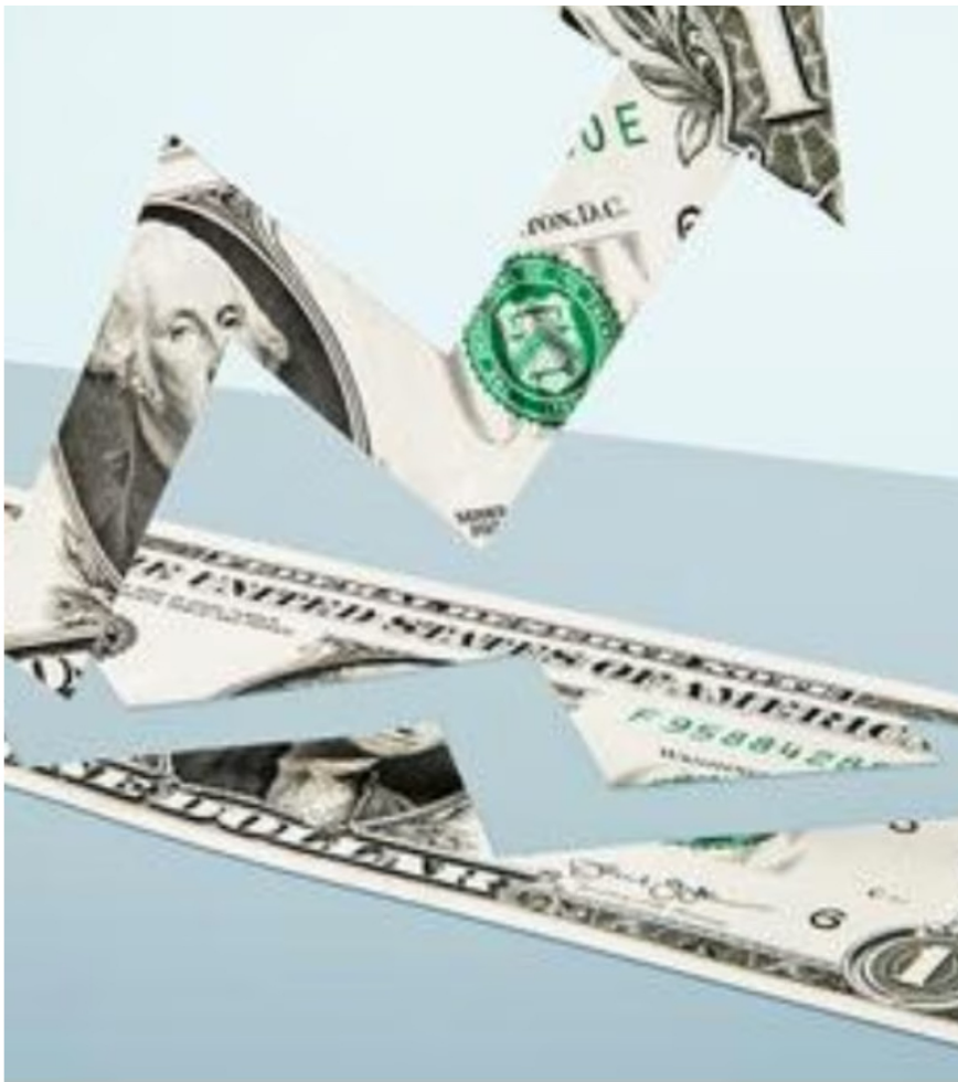
Dólar sigue con tendencia al encarecimiento.