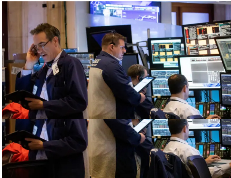
Las acciones de LatAm que sugieren expertos a quien busca dividendos.