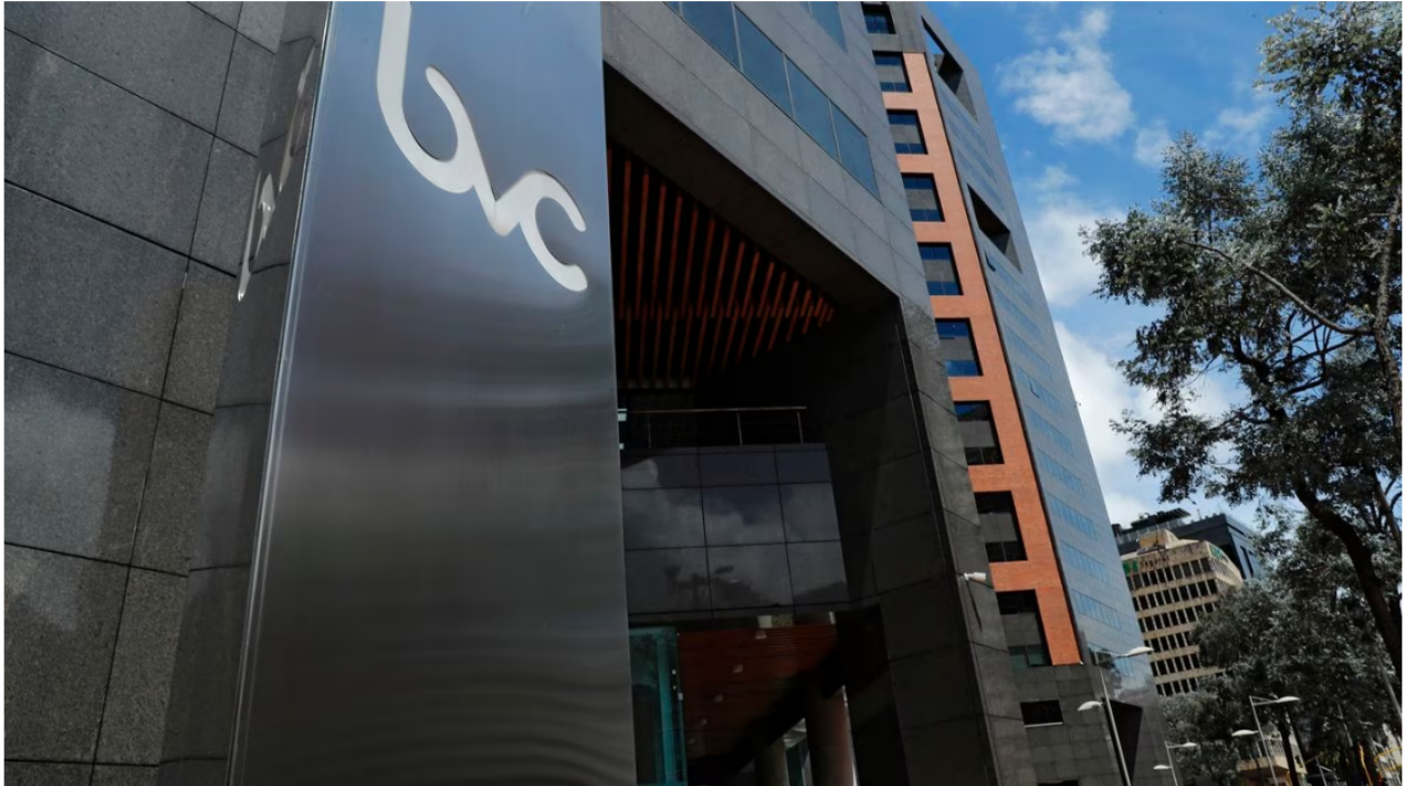
Así amanecieron las principales acciones del país en la BVC este 25 de septiembre.

Este lunes 25 de septiembre, los mercados en la Bolsa de Valores de Colombia abrieron en verde, luego de que el pasado viernes vivieran una jornada de caídas y una racha negativa que tenía la volatilidad en crecimiento.