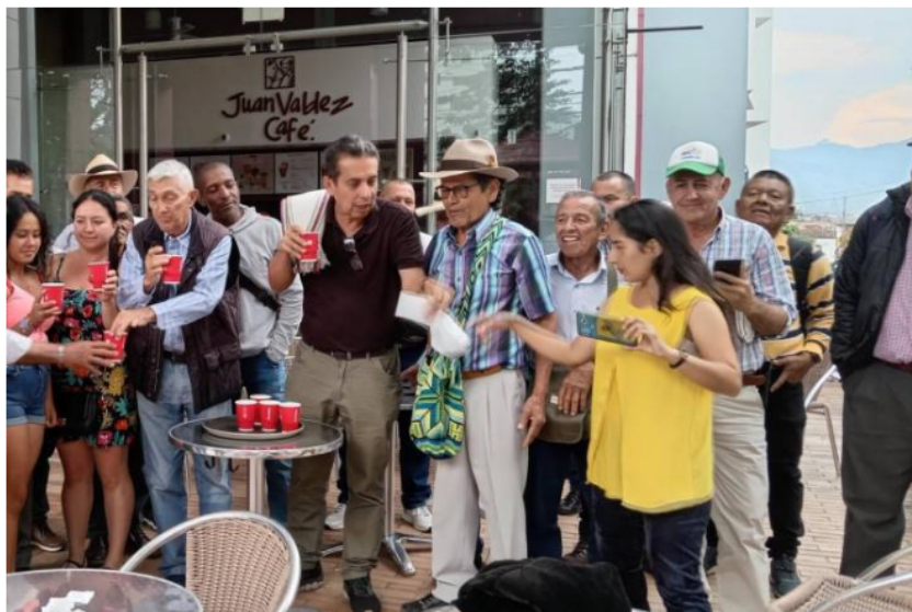
Alrededor de 40 líderes cafeteros se reunieron en un punto de venta de Juan Valdez y denunciaron que un vaso de café cuesta casi lo mismo que una libra que ellos cosechan. Piden que se añenda la crisis cafetera y anuncian paro.

Cafeteros advirtieron que siguen firmes en la decisión de convocar el paro cafetero ante la desatención del gremio para la que se han puesto de acuerdo la Federación Nacional de Cafeteros y el Gobierno nacional.