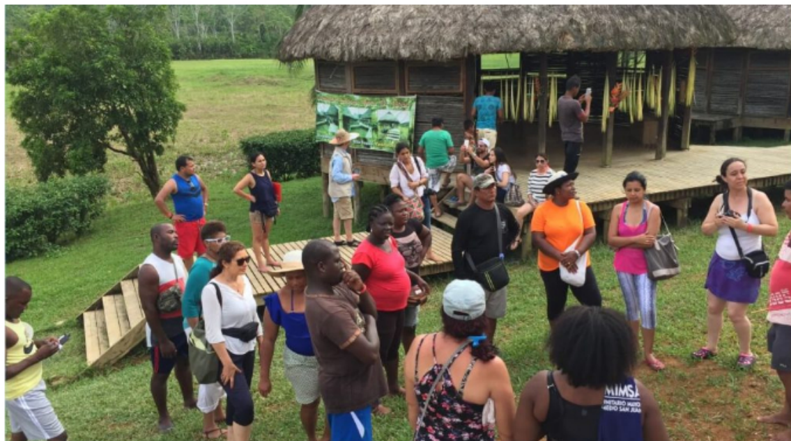
Según el estudio de la Cepal, la Agencia Francesa para el Desarrollo y el DNP, el turismo no logra mitigar completamente los efectos negativos de la descarbonización.