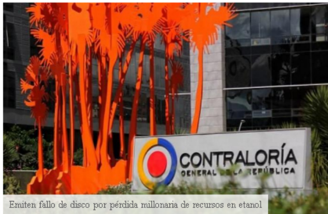
Emiten fallo de disco por pérdida millonaria de recursos en etanol

--- La Contraloría General de la República emitió un fallo con responsabilidad fiscal por $56.028 millones, debido a pérdida de inversión de recursos públicos destinados, durante los años 2010 a 2013, para apoyar el componente agrícola del proyecto de producción de etanol ‘El Alcaraván’.