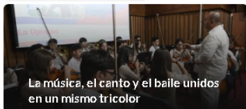
La música, el canto y el baile unidos en un mismo tricolor