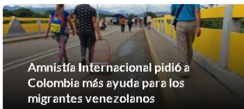
Amnistía Internacional pidió a Colombia más ayuda para los migrantes venezolanos