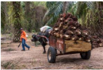
Cría de aves de corral y cultivos de palma de aceite impulsan la formalidad rural en Santander: Asocajas

El funcionario cuenta con el reconocimiento de ser Investigador Senior del Ministerio de Ciencia, Tecnología e Innovación de Colombia y ha participado como investigador en proyectos del ICP sobre temas de daño de formación, productividad de pozos y captura, utilización y almacenamiento de CO2.