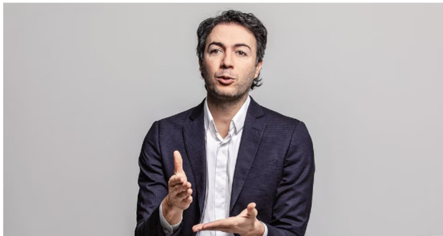
El alcalde de Medellín, Daniel Quintero.

SEMANA: Ya que habla de la crisis de Tigo Une, ¿cómo le fue en la asamblea?