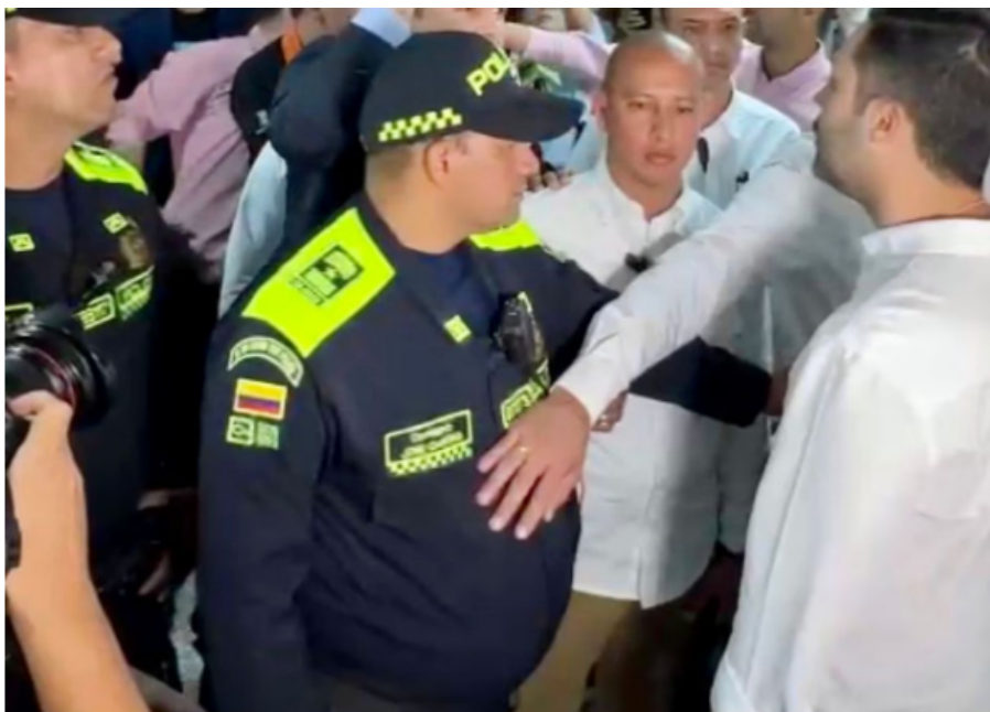
La confrontación entre el alcalde y el concejal se presentó este jueves 21 de septiembre.

SEMANA: ¿No cree que se dejó provocar por el concejal?