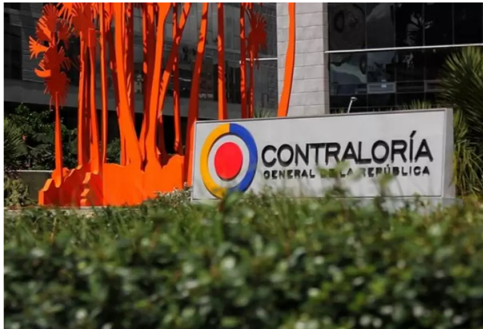
Contraloría General de la República