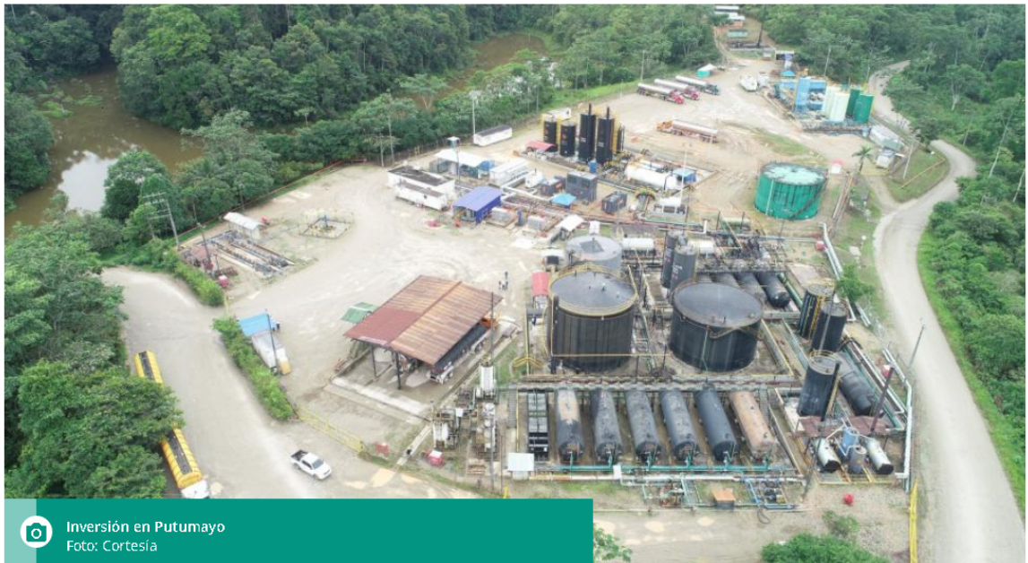
Inversión en Putumayo

En los próximos tres años, se harán inversiones por cerca de US$123 millones para aumentar el volumen de las reservas.