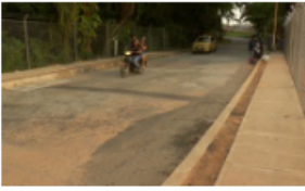
Apertura temporal de la vía aledaña al Club Infantas tras rehabilitación vial