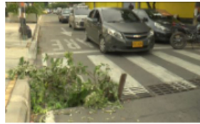
Peligro por falta de rejillas de alcantarilla en paso peatonal