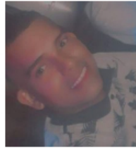
Video íntimo de joven pareja es viralizado en redes sociales