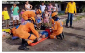
Se cumplió simulacro por accidente de tránsito