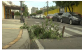
Peligro por falta de rejillas de alcantarilla en paso peatonal