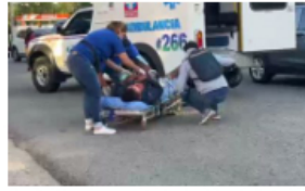
Accidente en la vía hacia El Centro involucra a menor de edad