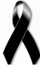
Segundo asesinato en menos de 24 horas en Barrancabermeja