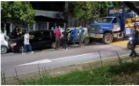
Accidente múltiple en comuna 4 de Barrancabermeja involucró cuatro vehículos