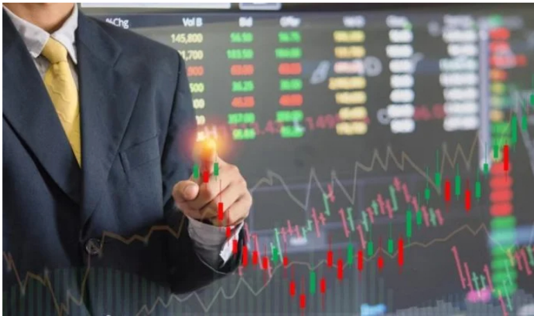
Bolsas mundiales

Las acciones recomendadas para invertir en Colombia, de acuerdo con la más reciente Encuesta de Opinión Financiera, son las de Ecopetrol e ISA. Entre otras causas, negocios de expansión y el precio del barril de petróleo llevan a esas preferencias.