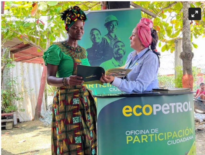
Refinería de Cartagena

En los últimos dos años, 195 emprendedores se han beneficiado con este programa