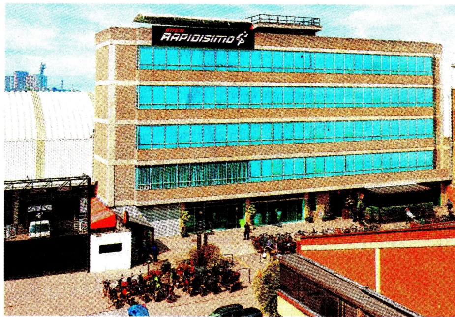
Según informe de MinTIC, Inter Rapidísimo se ha convertido en el operador postal de mensajería con mayor número de envíos individuales en el país. FOTO: INTER RAPIDÍSIMO

La información contenida es solo una guía general y no debe ser usada como base para la toma de decisiones de inversión o desinversión. Fuente: sificolombiana.com