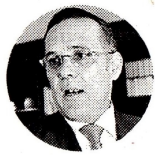
Efraín Cepeda Presidente de la Comisión Tercera

LAS COMISIONES ECONÓMICAS DEL CONGRESO APROBARON EL PRESUPUESTO DEL AÑO QUE VIENE, PERO EN SEGUNDO DEBATE DISCUTIRÁN MÁS DE 300 PROPOSICIONES