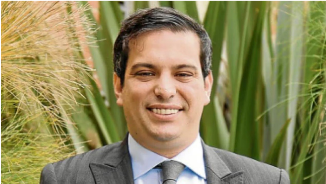
Simón Gaviria

19 de septiembre de 2023 Por: Redacción El País