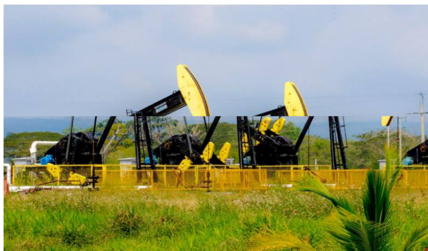
Este martes, el Brent alcanzó una cotización de US$95,94, la más alta en lo corrido de 2023.

El Ministerio de Hacienda había bajado la proyección a US$88.