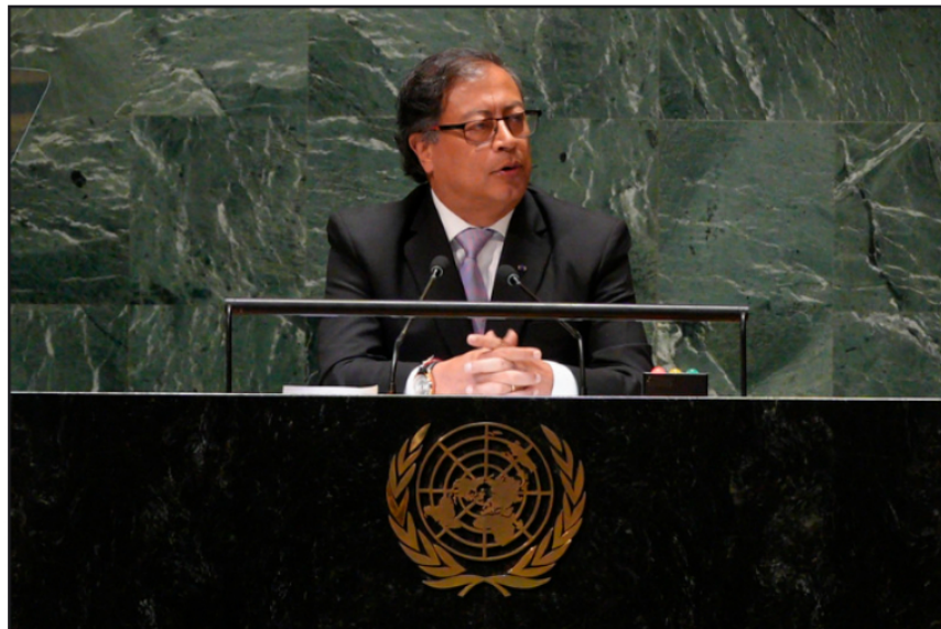
Petro insiste en liberar recursos a través de la reforma a la banca multilateral.

El presidente abogó otra vez por darle un giro a la banca multilateral.