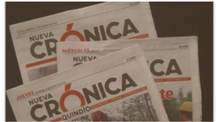
Opinión Reformas a... todo