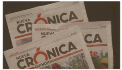
Opinión Mientras tanto: "Nacionalmente también pierde"