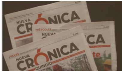
Opinión Tirando línea