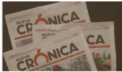
Opinión Día sin carro y sin moto en Armenia