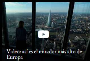
Video: así es el mirador más alto de Europa