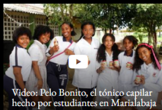
Video: Pelo Bonito, el tónico capilar hecho por estudiantes en Marialabaja