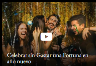
Video: Celebrar sin Gastar una Fortuna en año nuevo