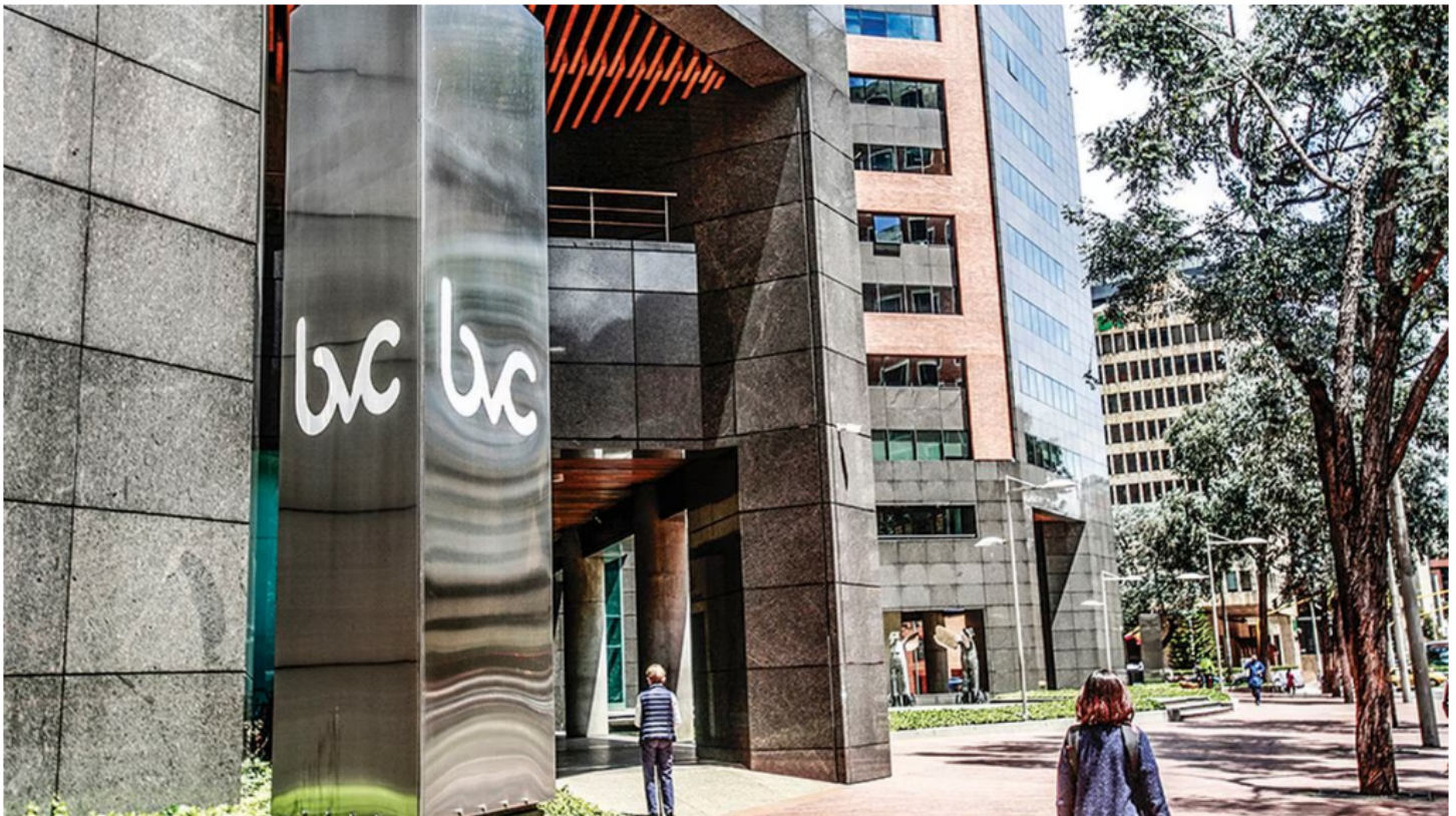
Bolsa de Valores de Colombia.

El corazón de la Bolsa de Valores de Colombia (BVC) vuelve a latir. Este jueves 14 de septiembre, el principal índice del parqué bursátil local; MSCI, tiene signos vitales de recuperación. Abrió la jornada con un repunte de 0,13 %, mientras que el acumulado de 12 meses va en rojo, con un -11 %.