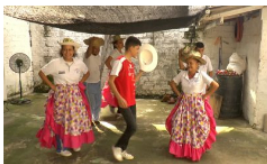
Sexto festival de danza y arte para la discapacidad