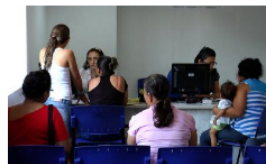
Plan de contingencia en la secretaría de Salud tras caída de plataforma