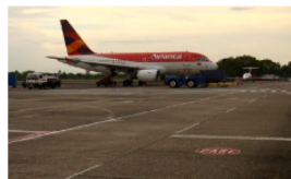
Aeropuerto Yariguíes en riesgo de cerrar por invasión de predios aledaños