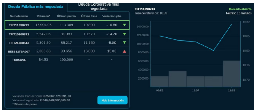
En el mercado de deuda pública colombiana, se observaron movimientos significativos durante la jornada, como el del título TFIT11090233, que experimentó una caída en su precio, registrando una variación negativa de 10.80 puntos básicos.