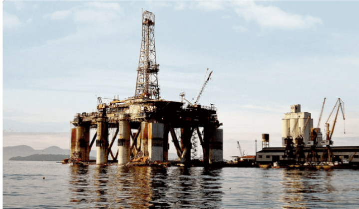
Hidrocarburos. El ingreso de Petroperú a los lotes de Talara aseguraría la continuidad de proyectos y la estabilidad financiera de la empresa estatal.

Precio del dólar hoy en Perú: ¿cuál es el tipo de cambio para este lunes 11 de septiembre? ¿Cuál es el cronograma de pago ONP en septiembre para jubilados y pensionistas?