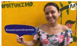
Ecopetrol 'le tiende la mano' a 840 emprendedores metenses