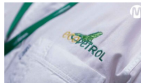
Ecopetrol abre convocatoria para estudiantes en prácticas académicas