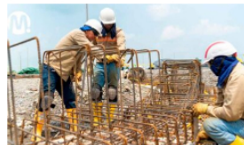
Ecopetrol ofertó cerca de 13 mil empleos el último año en el Meta