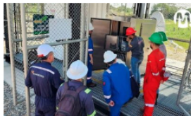
Ecopetrol usa tecnología eco-amigable para aumentar producción en el Meta