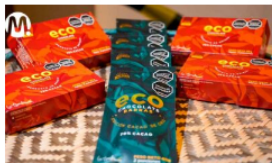
Apoiados por Ecopetrol , cacaoteros del Meta emprenden con chocolatería fina