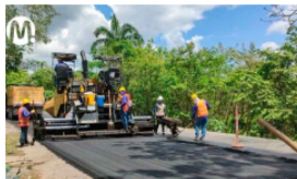
Ecopetrol destinó $767 mil millones para inversión social