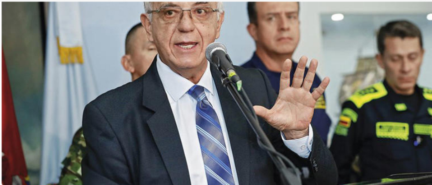
Iván Velásquez Ministro de Defensa

con la Defensoría del Pueblo, una de sus hijas está vinculada a Ecopetrol y su hija menor trabaja con la Corte Constitucional.