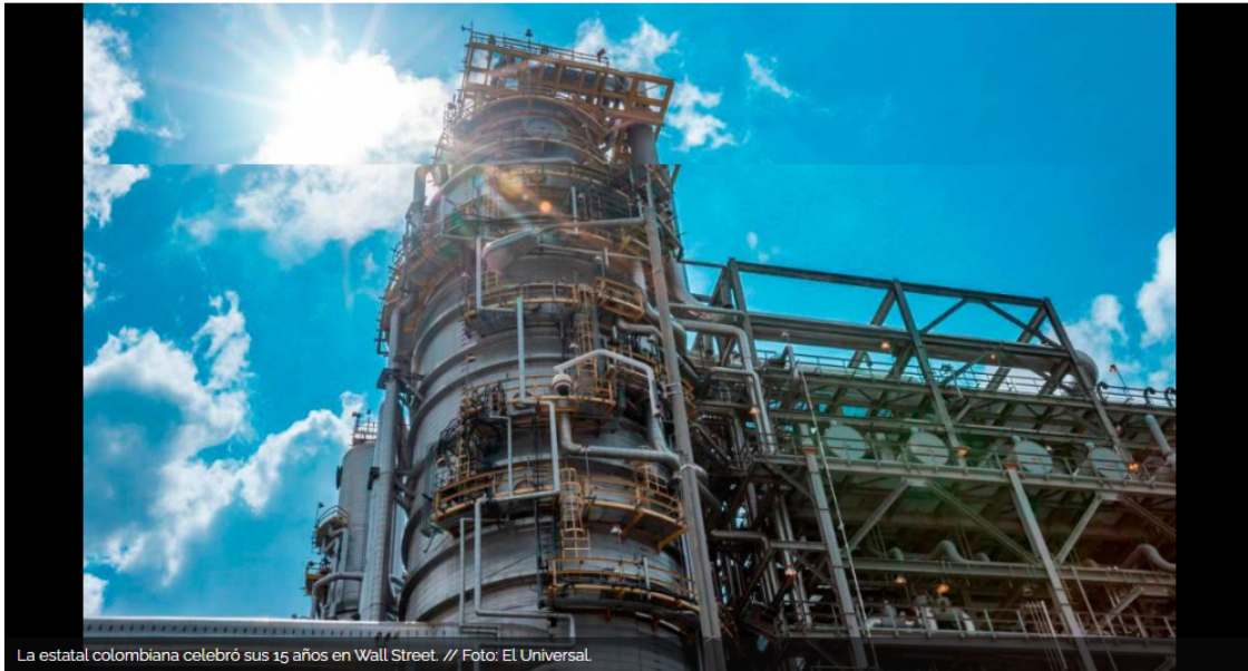
La estatal colombiana celebró sus 15 años en Wall Street.

Escuchar el artículo dando click al reproductor: