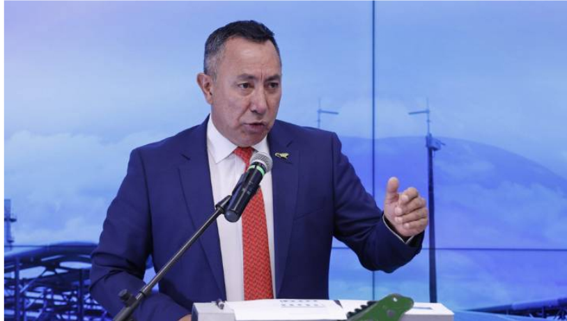
Fotografía de archivo fechada el 8 de agosto de 2023 que muestra a Ricardo Roa, presidente de Ecopetrol, mientras habla durante la presentación de resultados financieros y operativos del segundo trimestre de 2023, en Bogotá

Ecopetrol acelera la transición energética sin dejar el negocio tradicional del crudo.