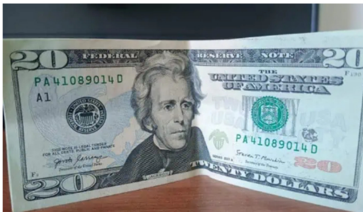
Dólar en Colombia se cotiza a la baja.