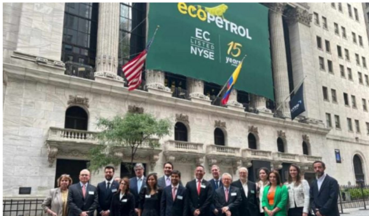
Ecopetrol participó en el Investor Day en Nueva York.

En el marco del Investor Day, que se llevó a cabo este lunes desde Nueva York (Estados Unidos), y en el que la compañía energética Ecopetrol presentó su estrategia a 2040, también se hizo alusión a temas financieros.