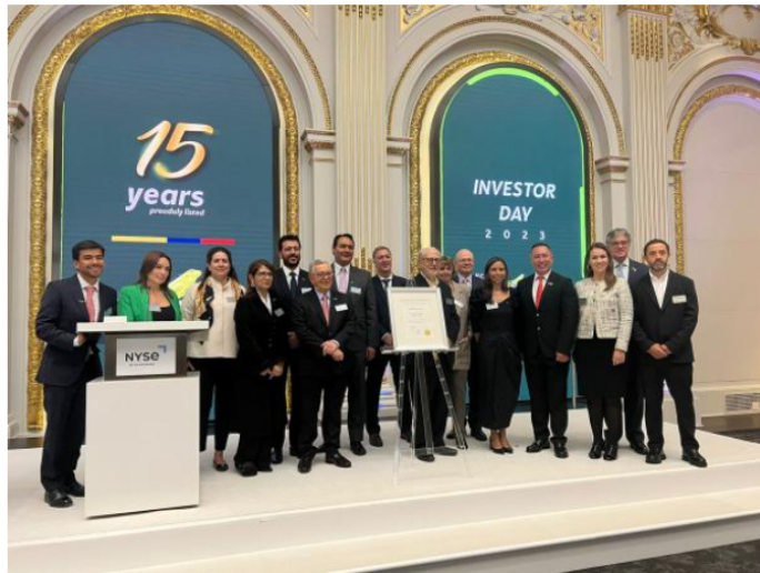
Ecopetrol en Wall Street Ecopetrol

"Para poder hablar hacia adelante, hay que mirar que la estrategia a 2040 está en marcha y está cumpliendo su promesa de valor en la definición que se hizo hace cera de año y medio. Vamos a seguir apostando a crecer junto a la transición energética", explicó Roa este lunes en Nueva York.