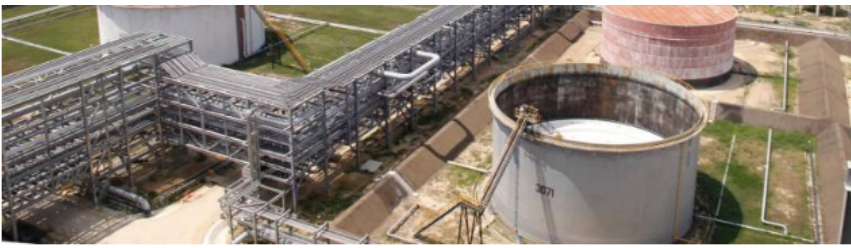
Reficar dijo que monitorea las medidas que McDermott ha tomado frente a la decisión del tribunal arbitral.

En ese sentido, continuó, Reficar “repudia las manifestaciones contrarias a la obligación de acoger las decisiones del más alto tribunal arbitral en materia comercial y por ello manifiesta que acudirá a todas las instancias posibles para defender sus intereses, y hacer respetar las decisiones arbitrales, tal y como se hizo durante el proyecto y el arbitraje”.