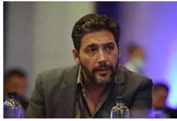
VIDEO: Reacción de Agmeth Escaf tras ser sacado del estadio en partido de Colombia