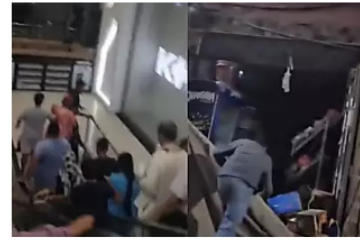
VIDEOS: Los impactantes momentos del terremoto en Marruecos