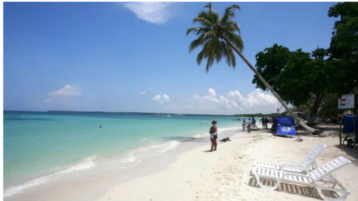
Playa Blanca, Barú.