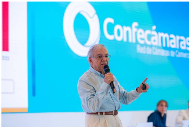
En rueda de prensa en el congreso de Confecámaras, la red de las Cámaras de Comercio de Colombia, el ministro de Hacienda, Ricardo Bonilla, aseguró que la discusión continúa en la mesa técnica para cambiar o no la fórmula del precio de la gasolina.

Ante la pregunta de la futura alza del precio del Acpm en el 2024 y de la propuesta de reducir la mezcla del biodiésel con el diésel, Bonilla explicó que es una discusión vigente, "pero el hecho cierto es que el precio del diésel está congelado desde el 1 de enero de 2020".