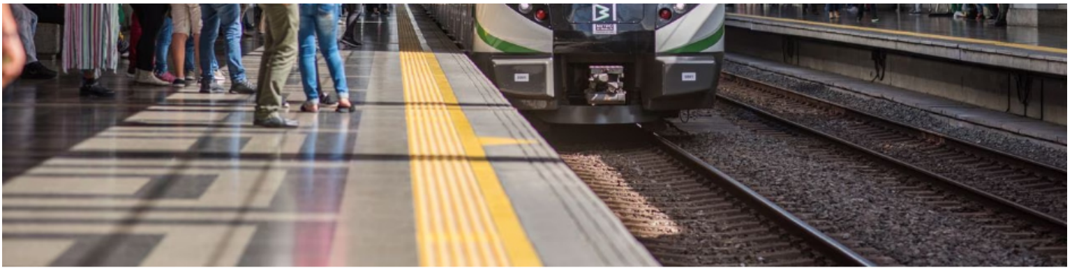
Panorámica de Medellín.

"¿De dónde se financia? Del bolsillo de todas las personas, de todos los ciudadanos a través de los impuestos, a través de la plata que sale de Ecopetrol , a través de un barril de petróleo, de las minas de oro, que se llevan la plata y dejan muy poquito acá", dijo Quintero en rueda de prensa.