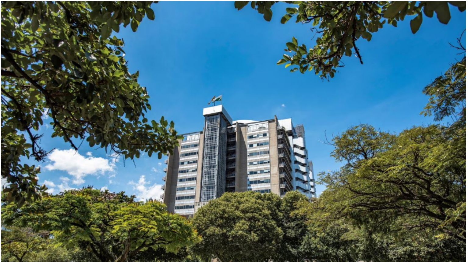
Edificio de Empresas Públicas de Medellín.