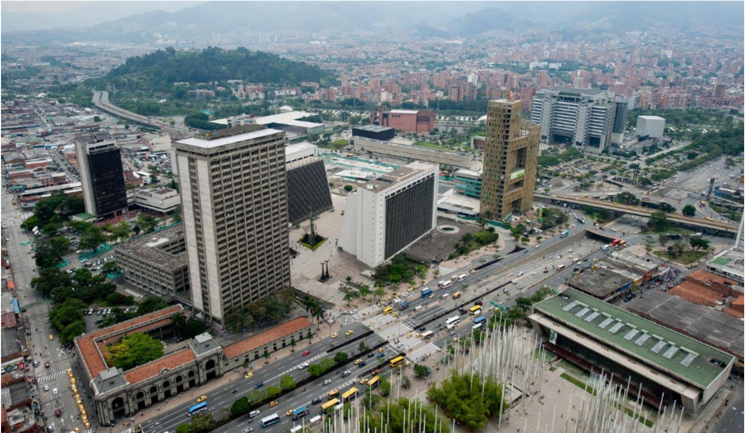
Panorámica de Medellín. | Foto: Cortesía: Alcaldía de Medellín.

“EPM es tan grande que una decisión que toma crea una presión sobre otros actores que también están en el mercado. Entre ellos, Celsia. Cuando yo digo que esa plata no se les debería cobrar a los ciudadanos, empiezan a decir: ¿y mi plata qué? ”, agregó Quintero.