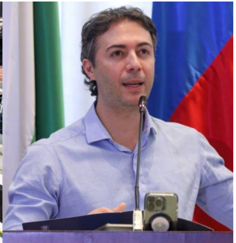
Metro de Medellín y Daniel Quintero.

“Me parece una idea maravillosa el hacer que el sistema Metro sea gratuito, que las personas no tengan que pagar para acceder a él”, expresó. Una figura que se estaría implementando con éxito en otros países del mundo que, además de cerrar brechas, reduciría la circulación de carros.