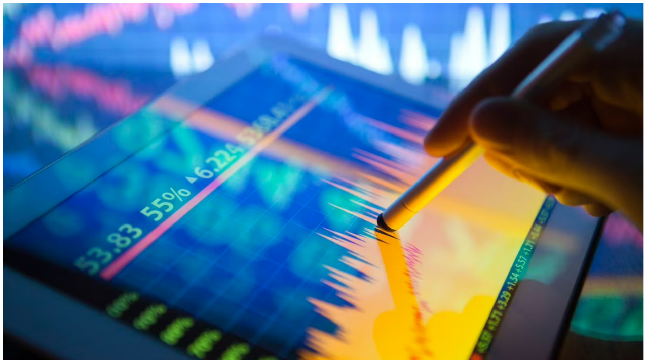
Las cifras presentaron reducciones considerables.

La jornada bursátil del martes 5 de septiembre cerró con cifras que prendieron las alarmas en los mercados. Y es que la Bolsa de Valores de Colombia (BVC) vivió un día con fuertes desplomes, donde la mayoría de los índices mostraron caídas preocupantes.