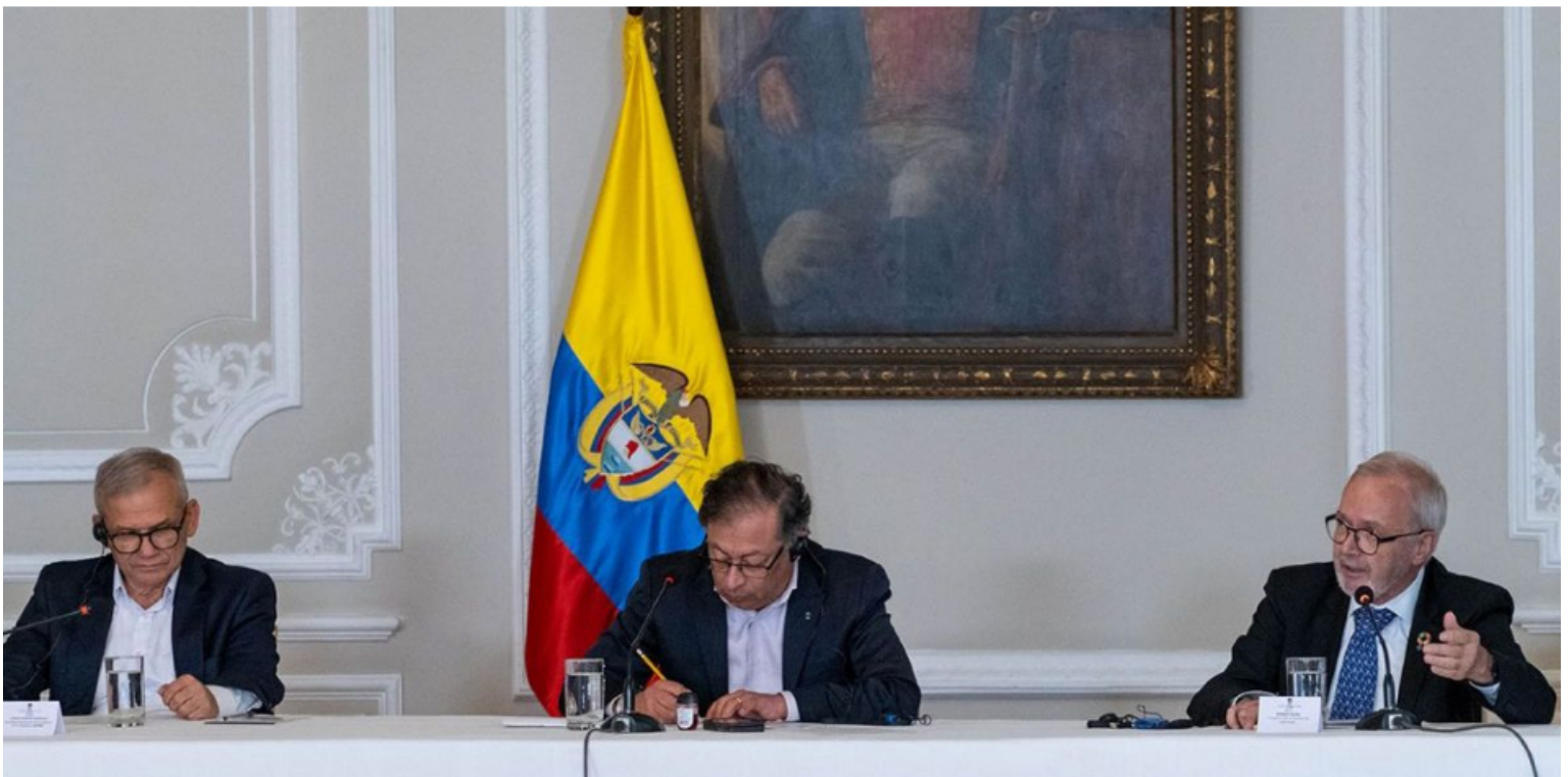
EL BANCO EUROPEO DE INVERSIONES REALIZÓ EL CONSEJO ECONÓMICO EN COLOMBIA