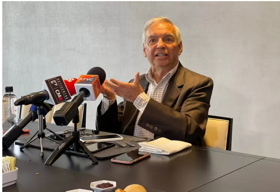
Ministro de Hacienda, Ricardo Bonilla