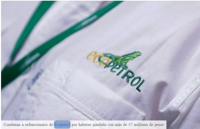
Condenan a exfuncionario de Ecopetrol por haberse quedado con más de 57 millones de pesos