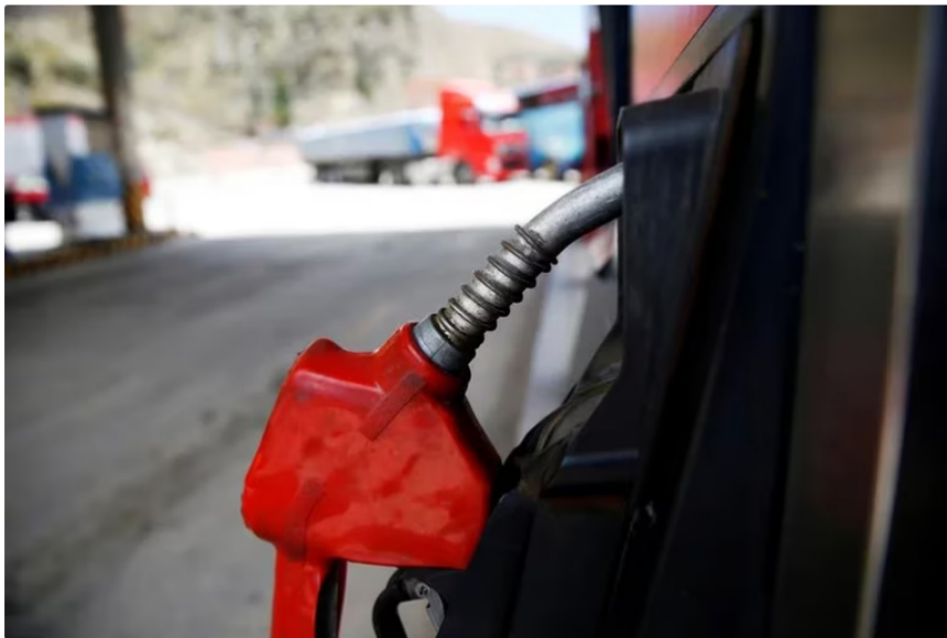
En la actualidad, el precio del galón de Acpm (diésel) está en $9.065 en Colombia

Durante el Congreso Nacional de Agencias de Viajes y Turismo de la Asociación Nacional de Agencias de Viajes y Turismo (Anato) celebrado en San Andrés, hubo un hecho que llamó la atención.