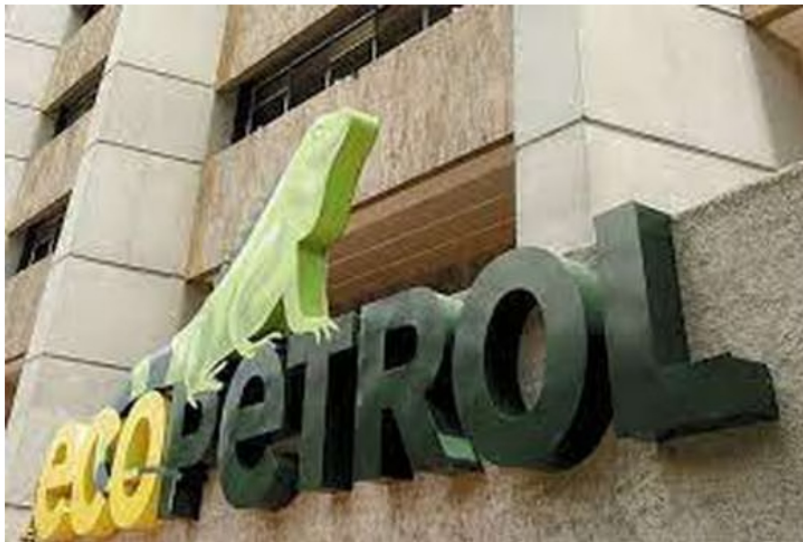
Gobierno admite que las ganancias de Ecopetrol ayudarán a estabilizar las finanzas públicas.