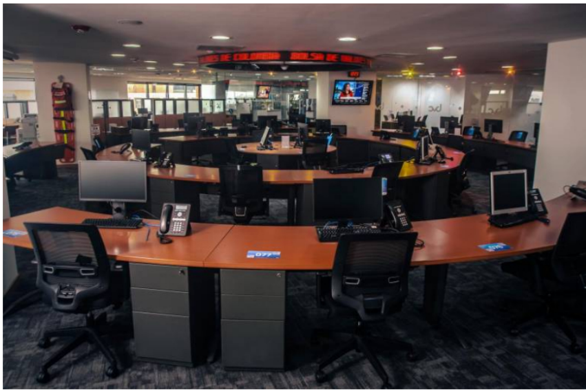
La BVC tuvo jornada negativa ayer.