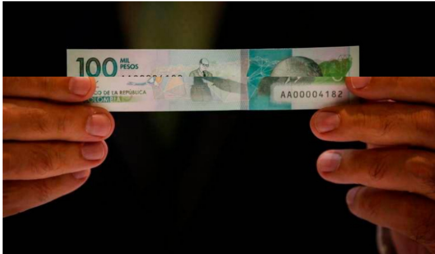
Baja liquidez, poca atracción para invertir y salida de capitales del país serían algunas de las consecuencias.

Esto implica una degradación que está relacionada con la incertidumbre política que atraviesa el país.