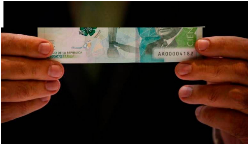
Baja liquidez, poca atracción para invertir y salida de capitales del país serían algunas de las consecuencias.

Esto implica una degradación que está relacionada con la incertidumbre política que atraviesa el país.