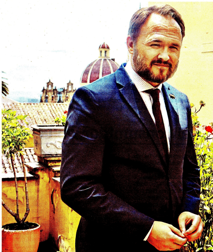
Dan Jørgensen, min. danés de Cooperación, Desarrollo y Política Climática Global.

combustibles fósiles, porque es más sencillo para los países que no son dependientes decir que otros deben hacerlo. En muchas formas Dinamarca también era altamente dependiente. Fuimos un productor importante de petróleo y gas, aún hoy producimos, pero hemos decidido movernos hacia adelante y fijamos una fecha para culminar las extracciones, que sería 2050, y hemos cancelado todos los licenciamientos hacia futuro. Esto solo se