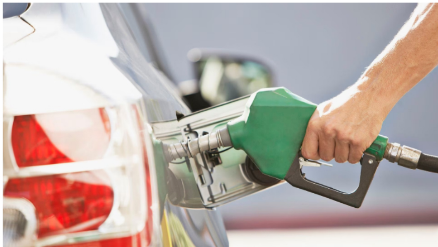
Reducción en la mezcla de Biodiésel generaría impactos negativos en el cumplimiento de las metas de descarbonización de Colombia: Fedecombustibles.

La Federación aclaró que el Biodiésel es un energético líquido renovable que apoya la transición energética justa. Proveniente de la cadena agroindustria nacional del aceite de palma, el Biodiésel reduce las emisiones de gases efecto invernadero, mejora la calidad del aire, el desempeño y la vida útil de los motores, genera empleos formales en áreas rurales, y garantiza la seguridad y soberanía energética del país. Es de destacar que la mezcla actual es del 10%, por otra parte, el país consume al mes cerca de 17 millones de galones mensuales de biodiésel.