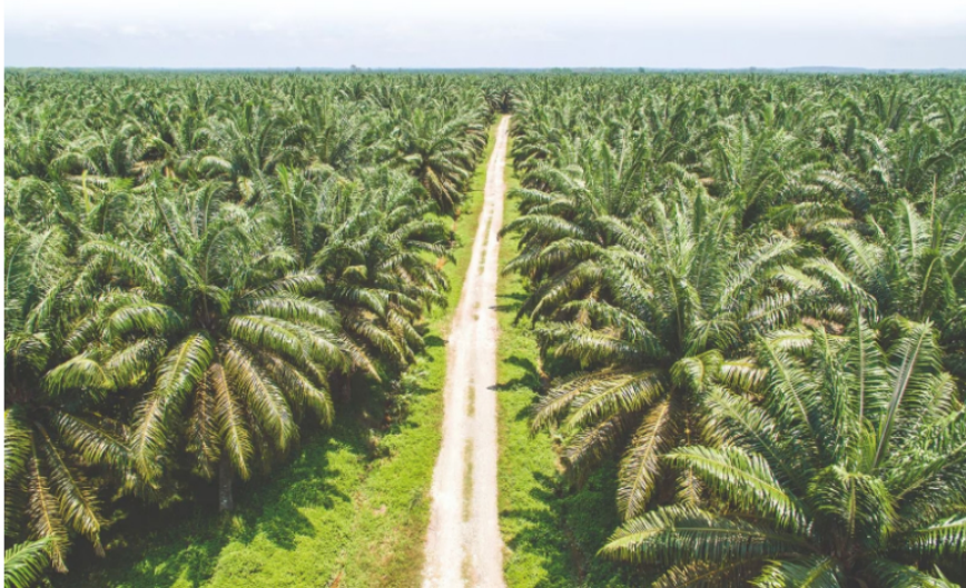
El evento busca ampliar el debate sobre el aporte del sector en la transición energética que busca el país