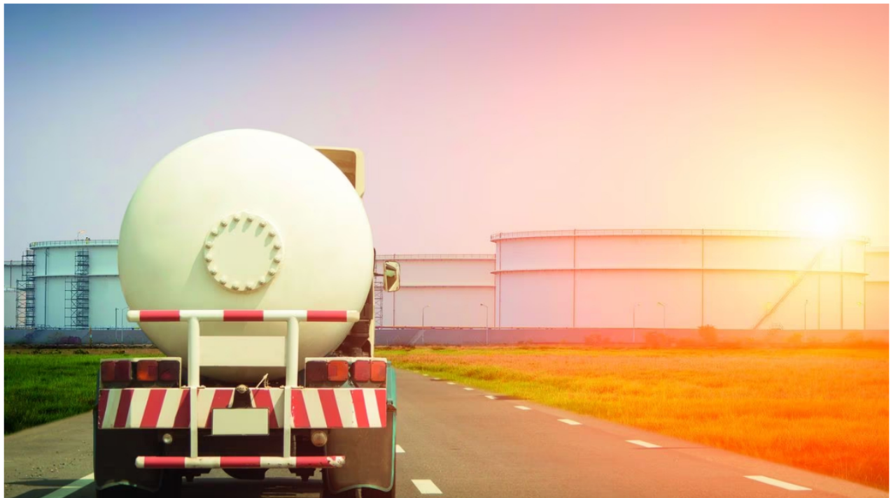
El Gobierno puso en marcha la ley que establece que, a partir del 1° de enero de 2023, el contenido de azufre en el ACPM debe estar entre 15 y 10 partes por millón.

Luego de conocer la propuesta de reducir la mezcla de Biodiésel en el diésel de Colfecar, la Federación Nacional de Biocombustibles de Colombia mostró preocupación. Según el gremio, la propuesta va en contravía de las metas ambientales del país, del encadenamiento agroindustrial, la calidad del aire, y no garantizaría una disminución en el precio del diésel.