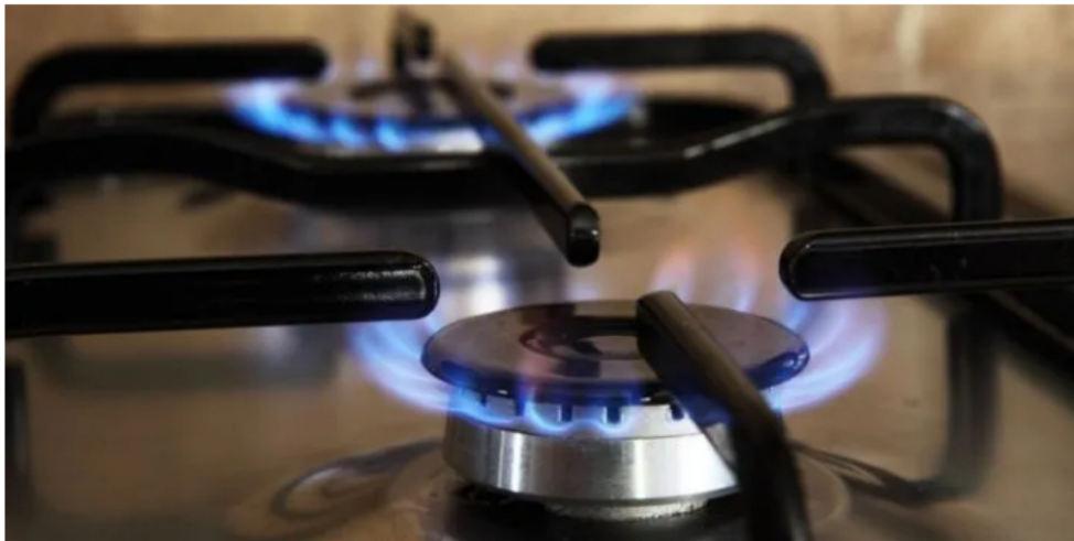
Imagen de referencia del gas natural.