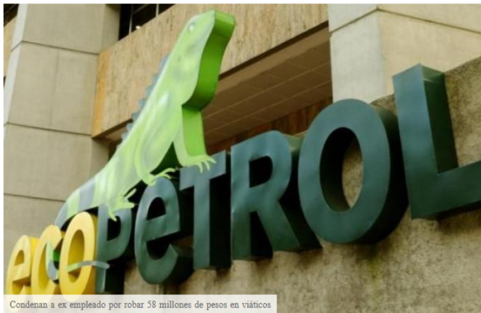
Condennan a ex empleado por robar 58 millones de pesos en viáticos

LOCAL Stacy Local about 3 hours ago REPORT