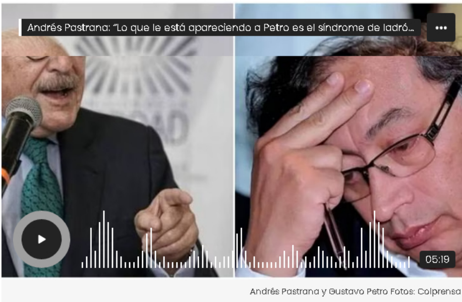
Andrés Pastrana y Gustavo Petro

El expresidente de Colombia aseguró en 6AM que la polémica por las declaraciones del hermano del presidente Gustavo Petro, para él, solo busca tapar que se está cumpliendo con el ‘pacto de la Picota’