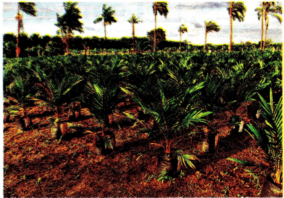
La medida desincentivaría la producción de combustibles sostenibles otros sectores. Archivo

Finalmente, dicen que esta propuesta implicaría un desincentivo para la producción de combustibles sostenibles otros sectores